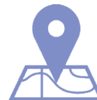
PNM La Murta y la Casella